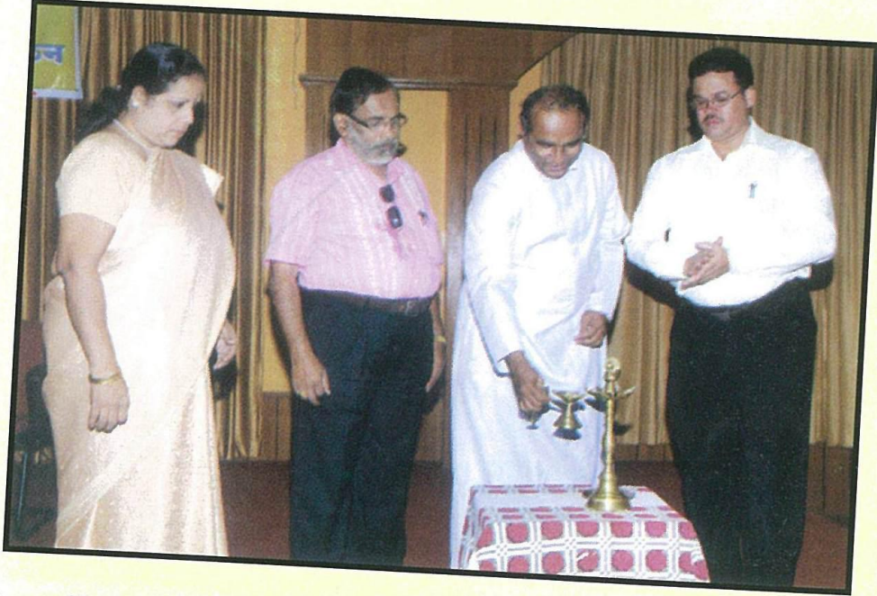
गोवा कोंकणी अकादेमी आणि रुवींद्र भवन, मडगांव हांणी जोडपालवान आयोजीत केल्ल्या दुसऱ्या बालसाहित्य संमेलनाचें दिवली पेटोवन उक्तावण करतना अवद लेडी ऑफ स्नोज हायस्कूल, द्याच संस्थेचे प्रिन्सीपल फा. शिप्रीयान ढ सिल्वा.